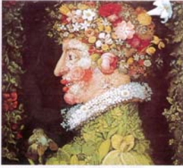
春(油画) 1512 列奥纳多·达·芬奇

每个人都想创新。要想创新，首先就要学会思维。如果我们的思维只是和平时一样，肯定不会创作出好作品。只有敢于打破常规的想法，换一种新的思维方式，并且大胆地去画，即使失败了也不怕，才有可能在创新的道路上迈出坚实的一步。