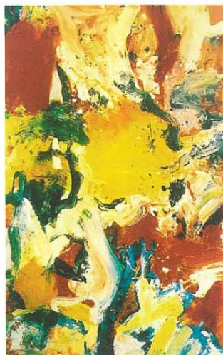
▲无题（油画）现代 德·库宁（美国） 画中的色彩随着纵横交错、不同力度的笔触恣意挥洒，没有明晰的界限和秩序，是抽象表现主义的杰作。