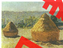
▲干草堆(油画) 1824 莫奈(法国) 莫奈善于捕捉自然的光彩夺目，与天空和地面的微妙变化相融合，构成一种色与光的交响。