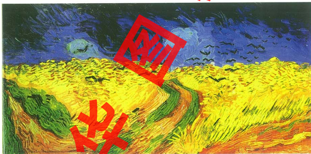
▲乌鸦群飞的麦田（油画）1890 凡·高（荷兰） 后印象主义画家凡·高对黄色的热爱炽烈而持久。色彩对比鲜明而明亮的麦田，燃烧着画家激情的火焰，倾注着他内心激荡的情感。

人类早期绘画的色彩表达具有很强的装饰性。19世纪的印象主义画家着力于光色关系与色彩变化规律的探索。20世纪以后，随着现代艺术思潮的出现，许多画家开始尝试以强烈、自由而主观的色彩来造型和表现，这种色彩被称为“表现性色彩”。