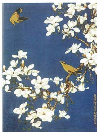
▲玉兰黄鹂（中国画）现代 于非闇 画面以石青为底色来烘托玉兰花和黄鹂鸟，强烈的色彩对比，生动地表现出了一派晴空万里、鸟语花香的大好春光景象。典雅华贵的色彩令人赏心悦目，充分地显示出工笔重彩画对色彩的精彩运用。