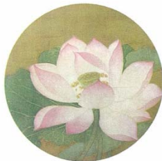
▲出水芙蓉图(中国画) 南宋 佚名 作品为了表现荷花“出淤泥而不染”的纯洁、娇艳的姿态与品格，分几十次层层渲染进行赋色，达到了柔和润泽而又艳丽动人的艺术境界。