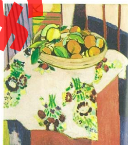
▲静物(油画) 现代 马蒂斯(法国) 野兽派画家马蒂斯追求一种简洁明快色彩效果，这幅暖色调为主的作品，明确地表达出了一种温暖、柔和、安适的气氛与情调。