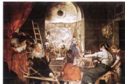
▲纺织女（油画）1657 委拉兹开兹【西班牙】 画中还着壁柱上面的是技艺女神帕拉斯因愤怒而把纺织女阿莱中变成蜘蛛的神话故事，近景则是纺织工妇正在劳动的纺织女。画家在现实与神话的意味深长的对照中，突出表现了劳动者健康、淳朴的美。