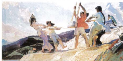
▲齐歌（油画）1962 王文彬 三个年轻姑娘在水库建设工地唱响了齐歌，明媚的阳光映照着她们黧黑的脸庞和健壮的身躯。她们劳动得那样和谐，那样欢乐！欣赏这一作品可以感受到青年一代献身祖国建设的坚定决心和美好理想。

► 扶康担 福义（李四画）【现代】 深寒本 2008年 5·12汶川特 大地震灾 到东的时 解放军官兵 抢险救灾 白衣战士和 志愿人员等 全力以赴 抢救生命 斗争，集中 展示了中 国人民崇 高的道德 品质和 精神面貌。