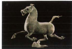
▲御神马（青铜雕塑）【东汉】 作者造型巧妙地利用了力学支点，塑造出腾空飞奔的骏马形象。马呈奔跑状，头高昂，尾上扬，张口作嘶鸣状；三足腾空，右后足踏在一只疾飞的鸟背上，衬托出骏马奔驰的冲劲与轻盈。塑像立意新颖，构思巧妙，给人以传神的美感，是享誉中外的著名青铜雕塑杰作。

艺术的功能主要是通过满足人们的精神需要，提高人们的文化素质，陶冶人们的道德情操，以促进社会的发展与进步。为此，艺术作品就应当坚持倡导和弘扬真善美，揭露和鞭笞假恶丑。